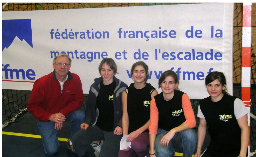
Les filles qualifiées au France et leur entraîneur